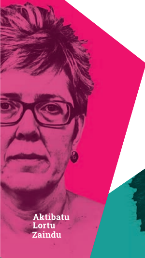
Aktibatu Lortu Zaindu