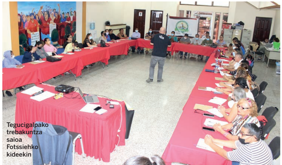
Tegucigalpako trebakuntza saioa Fotssieho kideekin

2009ko estatu kolpearen ondoren, sindikatu eta mugimendu sozialek bultzatuta indartzen joan den